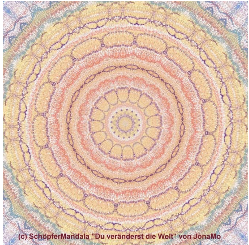
(c) SchöpferMandala "Du veränderst die Welt" von JonaMo