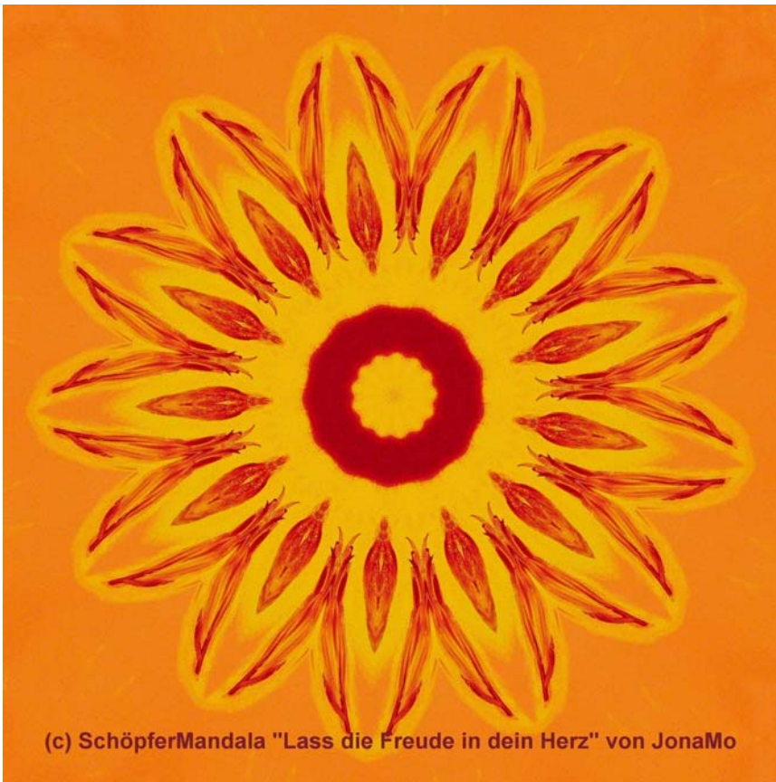
(c) SchöpferMandala "Lass die Freude in dein Herz" von JonaMo